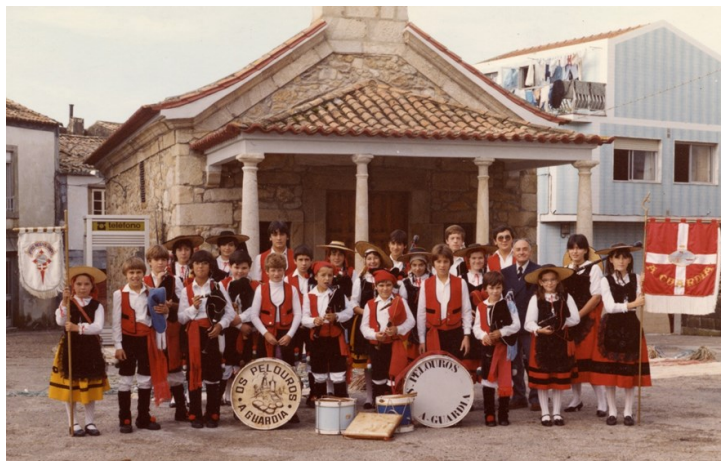
Grupo de gaitas Os Pelouros, nunha imaxe do ano 1983.