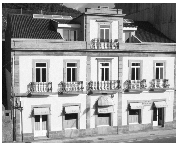
Edificio do Recreo Artístico Guardés, sede social en propiedade dende o ano 1974.