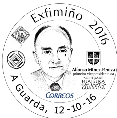
Cuño especial concedido por Correos.. Deseño de Ángel Pérez Martínez, para EXFIMIÑO 2016