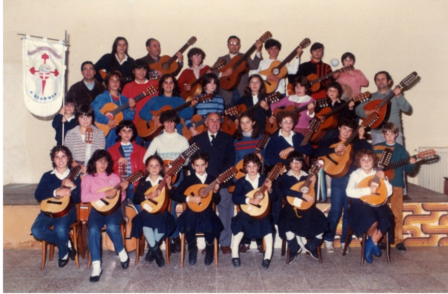
A Rondalla do Recreo Artístico Guardés, nunha imaxe de 1983.