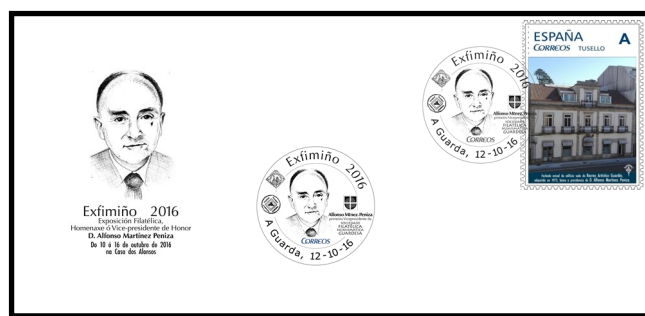
Sobre oficial da XX edición da mostra EXFIMIÑO