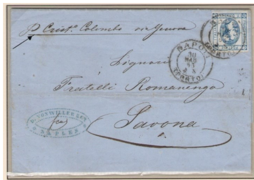
Nome del barco