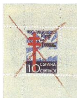
Emisión de fecha 22 de diciembre de 1938

Co fin de obter cartos para o coidado dos enfermos, fóronse lanzando algúns timbres antituberculosos, en España lánzanse durante a Guerra Civil en la zona franquista. Estas emisións saen no Nadal de 1937 e 1938. A primeira delas deu un beneficio de 760.626 pesetas. Trala Guerra aparecen novas sobretasas postales a favor da loita antituberculosa (Pereira Poza 1999, 90). No seu deseño, moi lonxano dos motivos propostos por médicos coruñeses, un dos elementos constantes foi a Cruz de Lorena símbolo mundial da loita antituberculosa.