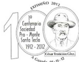
Matasellos especial concedido por Correos