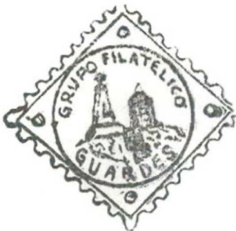
Anagrama del Grupo Filatélico Guardés