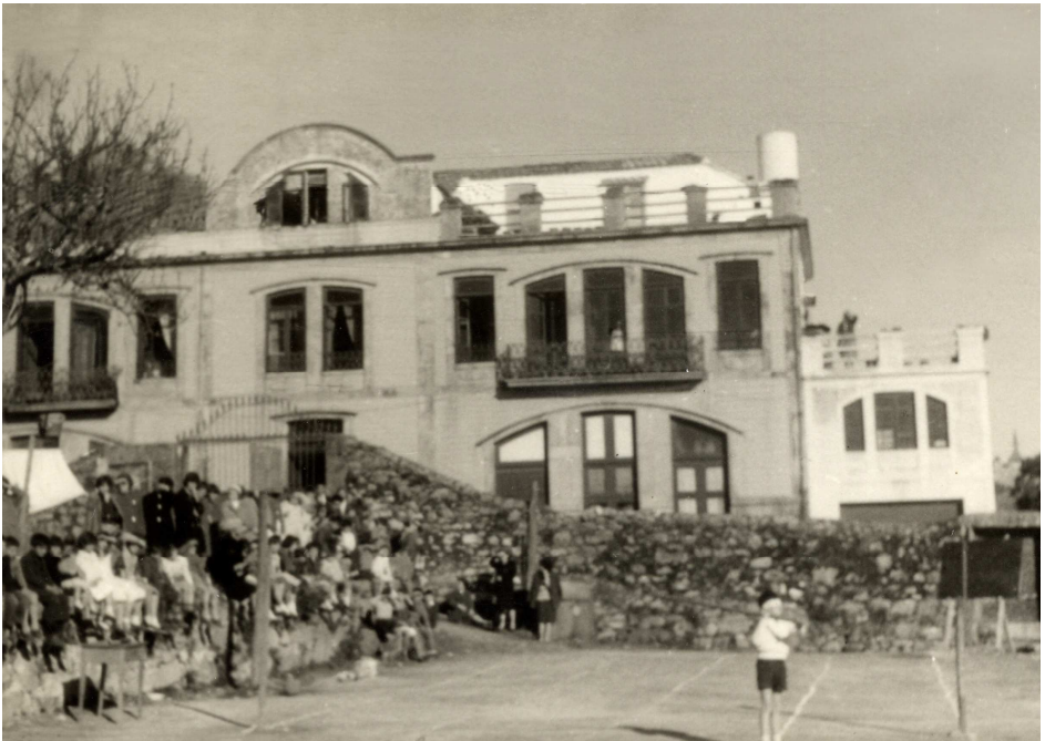
EXPOSITORES EXFIMIÑO XXVI 2011 A GUARDA