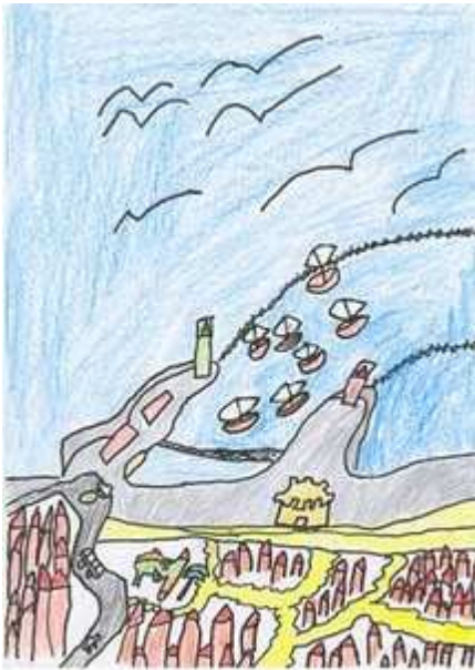
CÉSAR ROMERO FAJAR, COLEXIO A SANGRIÑA

Os gañadores en compañía dos seus respectivos pais serán invitados a inauguración da Exposición EXFIMIÑO 2011 a celebrar os días 8 ata o 13 de outubro nos salóns do Recreo Artístico Guardes donde se fará entrega dos premios a os gañadores.