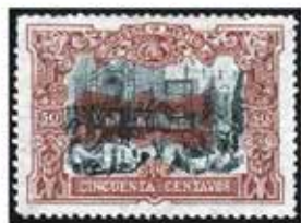
Reimpresión horizontal en rojo en sello de 50 centavos.