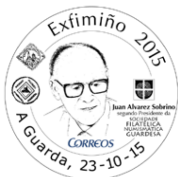
Cuño especial, concedido por Correos. Deseño de Ángel Pérez Martínez para EXFIMIÑO 2015