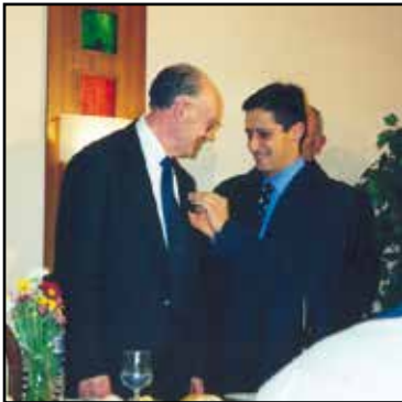
Entrega de la medalla de oro de la "Sociedade Filatélica Guardesa" en la EXGAPORTEM 2001