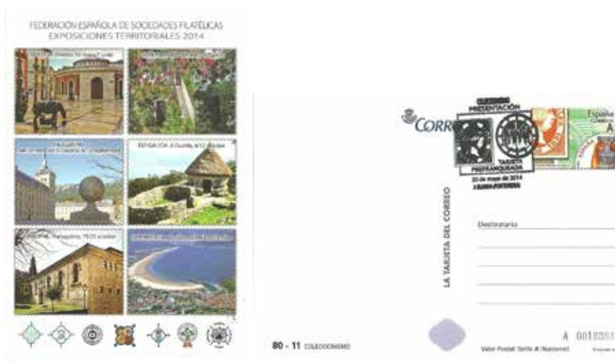
Anverso del enteiro postal

Por parte de Correos presentou un Enteiro Postal dedicado ao Colecciónismo coa imaxe do poboado Castrexo del Monte Santa Tecla.