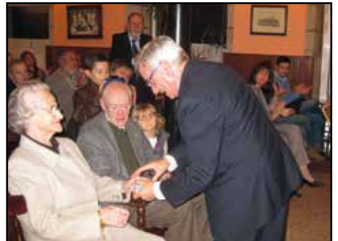
Entrega de la "Insignia de Oro" al Mérito Filatélico de FEGASOFI en el año 2010