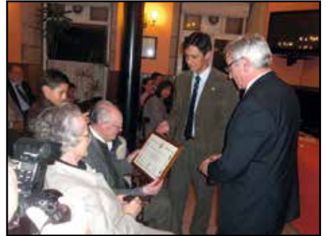
Entrega del Diploma de "FEGASOFI" al mérito filatélico en el año 2010