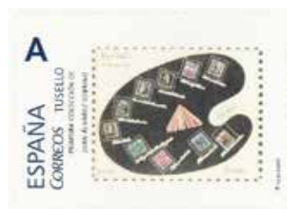
Selo personalizado concedido por Correos