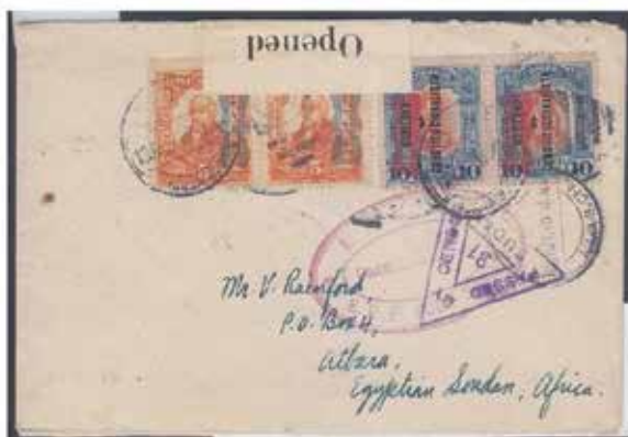
Carta de México del 13 de noviembre de 1918 con varias marcas de censura militar, dirigida a Sudán con reimposición de "corbata" en azul (C. P. De M.) y en rojo con reimposición del Gobierno Constitucionalista.

En todos los valores existen "pruebas" manipuladas. Además del rojo, azul y negro también se utilizaron los colores café y verde, como el ejemplo que se muestra.