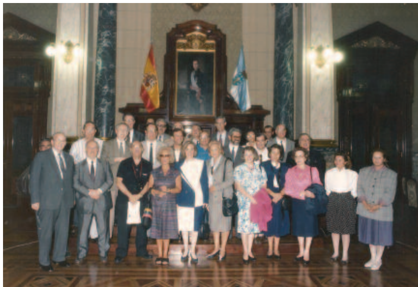
Recepción no concello da Coruña.

Para conmemorar tódolos actos o Concello encargou varios obsequios que foron distribuídos entre os asistentes.