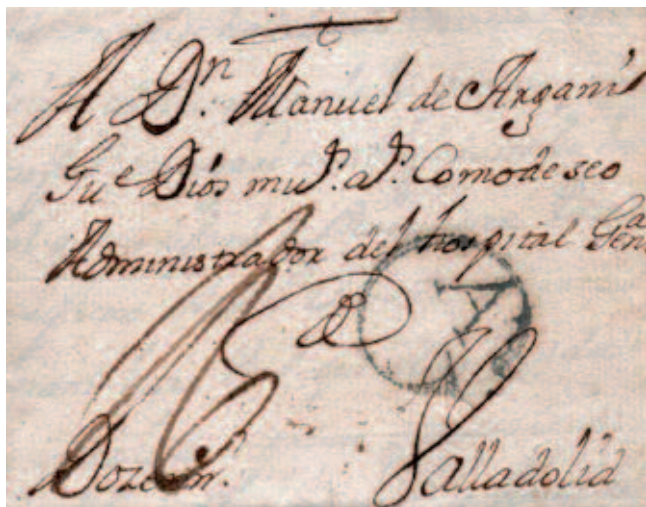
Carta de Orense a Valladolid en 1741. Marca de origen de Orense.

Algunas de estas marcas se siguieron utilizando después de la aparición del sello adhesivo en España en el año 1850. En Galicia, de nuevo, se encuentra el mayor número de marcas de época prefilatética utilizadas fuera de su periodo temporal natural. La dispersión y, sobre todo, el gran número de núcleos de población, propició esta situación. En muchas de las Estafetas-Carterías, al no contar con ninguna marca oficial, se siguieron usando estas marcas antiguas para identificar la oficina correspondiente, sin ninguna autorización de la autoridad, que dejaba hacer sin más. En muy raras ocasiones estas marcas se utilizaron para anular los sellos adhesivos.