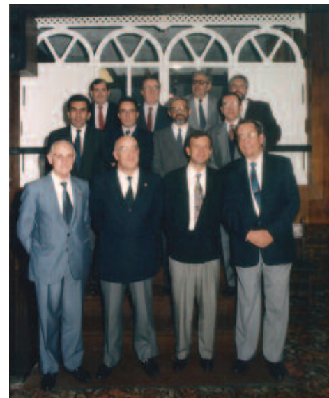
A Directiva da Sociedade Filatélica da Coruña co concelleiro de Cultura.

E así rematou unha das mellores Exposicións Filatélica feitas na Cidade da Coruña onde, como é sabido, "Ninguén é forasteiro", como recoñeceron os coleccionistas de toda España que nela participaron e que, de cotío, veñen a nosa cidade a participar en cantas exposicións facemos.