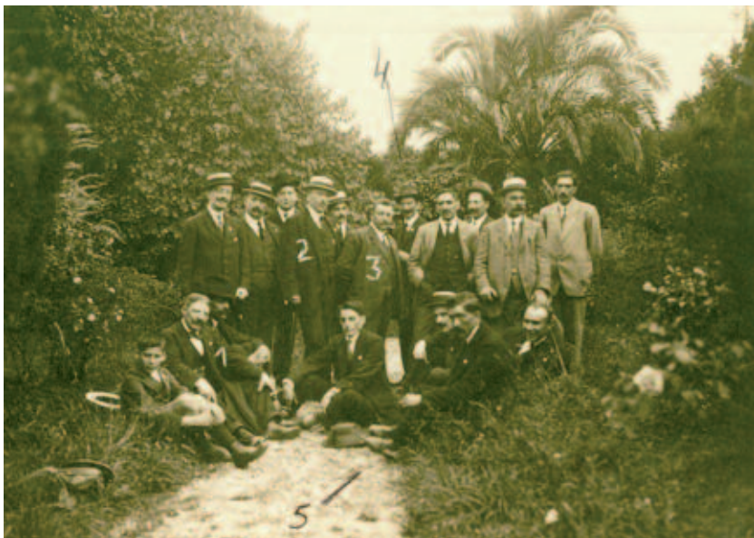
Única foto dos compoñentes das Irmandades nunha viaxe a Pontedeume.

Antón Villar Ponte non lles falta ó respecto ós Precursores (Murguía, Rosalía, Pondal...), ós que califica de “sublimes”, pero denuncia carencias graves da súa galeguidade. El pensa –está plenamente convencido– que chegara a hora de que a clase media volvese ó “uso del gallego”, como proclama no Manifesto: urxía recuperar “para nuestra causa, nucleos de personas cultas”. Hóboas, sen dúbida, a partir de 1916 pero a súa eficacia, sobre a clase media foi limitada (moi limitada?).