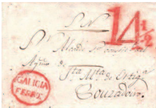
Carta de Ferrol a Couzadoiro en 1842. Porteo 14 ½ cuartos de Ferrol.

La modalidad del correo certificado surge por la necesidad de dar una mayor seguridad a cierta correspondencia, a cambio de un sobre porte, que pagaba siempre el remitente. En España se utilizaba el frente del pliego certificado a modo de recibo, de forma que una vez entregado al destinatario se recortaba y una vez firmado el recibí en el reverso, se enviaba a la oficina de origen por si lo reclamaba el remitente. Pasado un tiempo los frentes no reclamados se quemaban. Este hecho unido a la particularidad del servicio los hace muy escasos. En Galicia son muy pocas las marcas de cuño de mano, ya que se uso mayoritariamente la forma manuscrita. También D. Juan de Baeza unificó los diseños con un CERTIF dentro de un cartucho. Una característica casi general de los envíos certificados, en esta época, son las marcas a mano con forma de aspas que se ponían en los bordes del pliego.