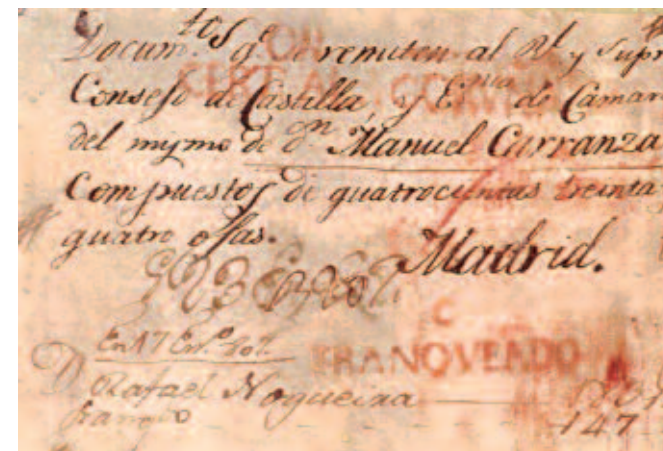
Pliego certificado de La Coruña a Madrid en 1807. Marca CERTON A LA CORUÑA.