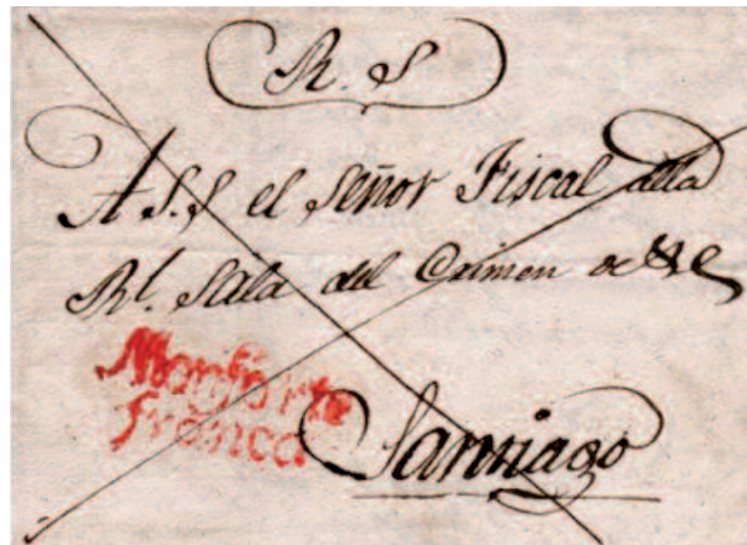
Carta de Monforte de Lemos a Santiago en 1830. Marca de franqueo de Monforte.

Son las que en distintos formatos y colores, aparecen indicando el nombre de la ciudad, pueblo o región postal (no siempre coincidente con la geográfica) y que se estampaban en el anverso o reverso de las cartas para indicar el origen, el tránsito o la llegada. Dentro de este grupo se incluyen las marcas que servían para señalar la procedencia del extranjero o ultramar; también las marcas de las Agencias Postales Inglesas establecidas en algunos puertos, en el caso de Galicia en La Coruña y Vigo. La primera unificación de diseños, a nivel nacional, lo acometió D. Juan de Baeza con la creación del fechador de 1842, que después se usaría como el primer matasellos oficial del sello adhesivo español, entre enero y primeros de marzo de 1850.