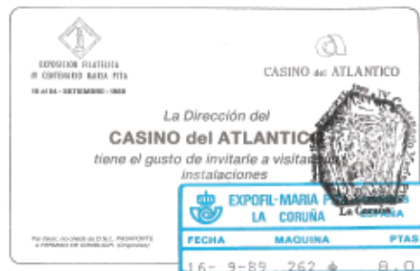
Invitación do Casino Atlántico aos participantes da exposición.

Durante os días que durou a Exposición as diferentes entidades públicas e privadas ofreceron ós participantes a ocasión de coñecer A Coruña e os seus arredores, así a Deputación Provincial levounos ó Pazo de Mariñán, na próxima vila de Bergondo. Tiveron tamén unha comida no Hostal dos Reis Católicos de Santiago de Compostela, unha visita guiada á Central Térmica de Meirama ofrecida por Unión-Fenosa e unha recepción no Concello da Coruña así como entrada libre ao Casino do Atlántico.