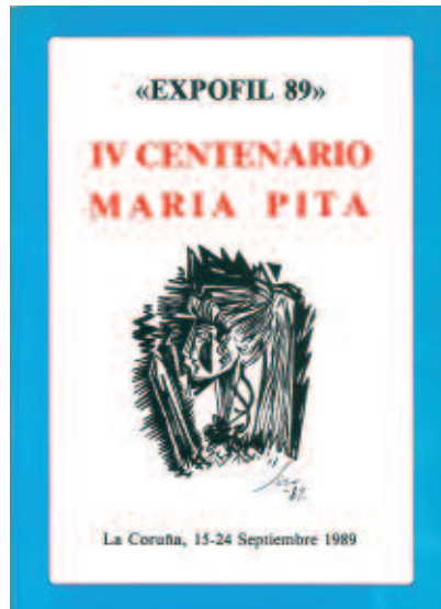
Cuberta do libro da exposición.