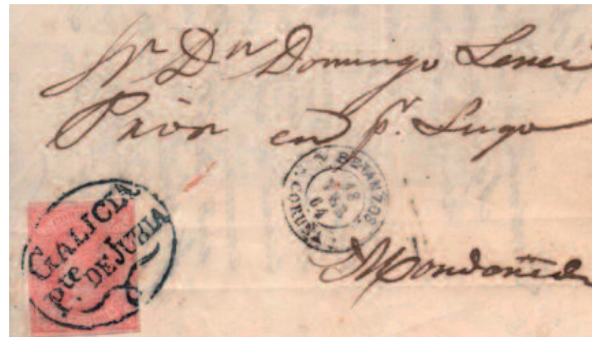
Carta de Jubia a Mondoñedo en 1864. Marca de época prefilatélica usada indebidamente como matasellos.

De estas cien oficinas se han localizado marcas de cuño, en distintas épocas, en setenta y ocho de ellas (es probable que en un futuro aparezcan más). Con más de cuatrocientas marcas de cuño de mano, Galicia es la Región Postal de España que más marcas tiene, amén de la variedad de los colores empleados. Sobre la belleza y variedad de sus diseños podría tratarse de una opinión subjetiva, pero todos los coleccionistas y estudiosos coinciden en que también en esto es la primera.