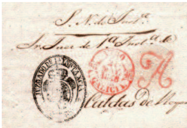
Carta de Vigo a Caldas de Reyes en 1848. Marca de abono de Vigo.