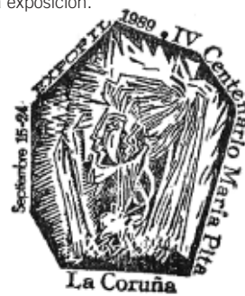
Mataselos conmemorativo da exposición.