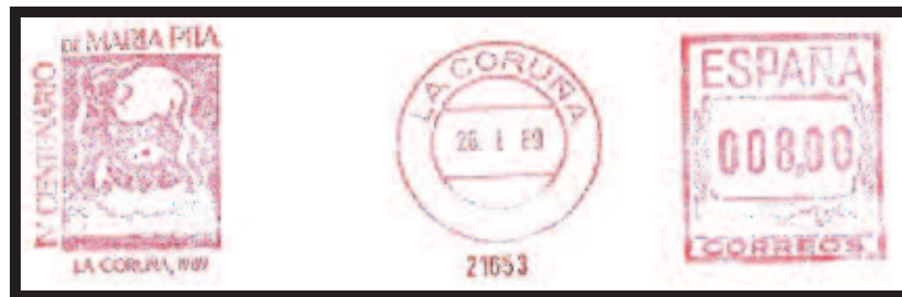
Franqueo Mecánico do IV Centenario María Pita.

Pola súa banda o Concello utilizóu durante todo o ano un Franqueo Mecánico anunciador dos actos do IV Centenario, empregando para elo e como logotipo dos mesmos un debuxo de Isaac Díaz Pardo representando unha idealizada María Pita.