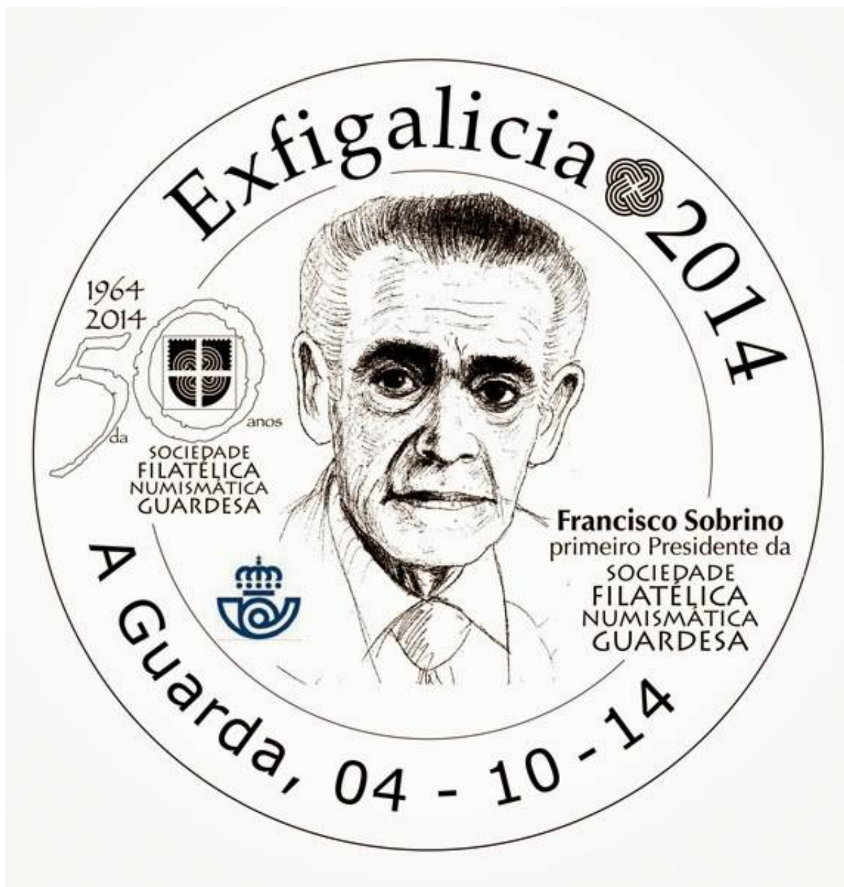
Matasellos especial concedido por Correos.