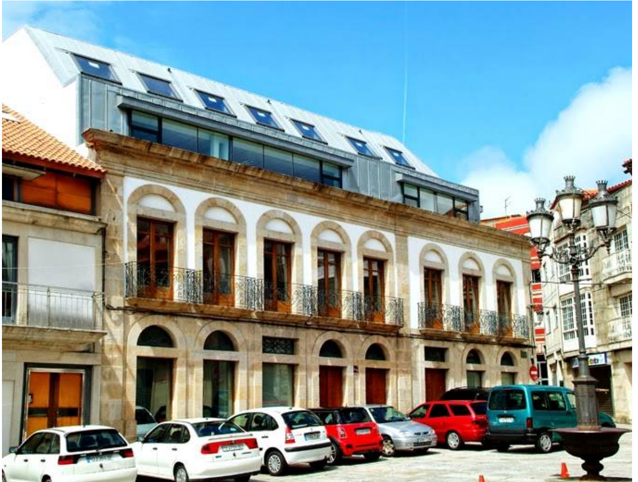
Local de la Exposición