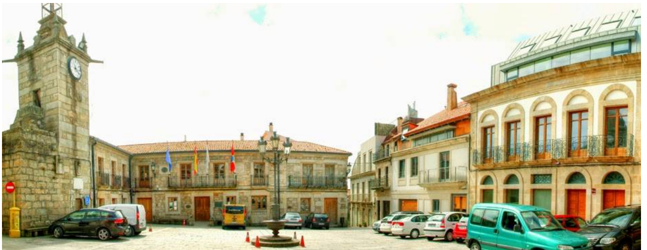
Ubicación: Plaza do Relo