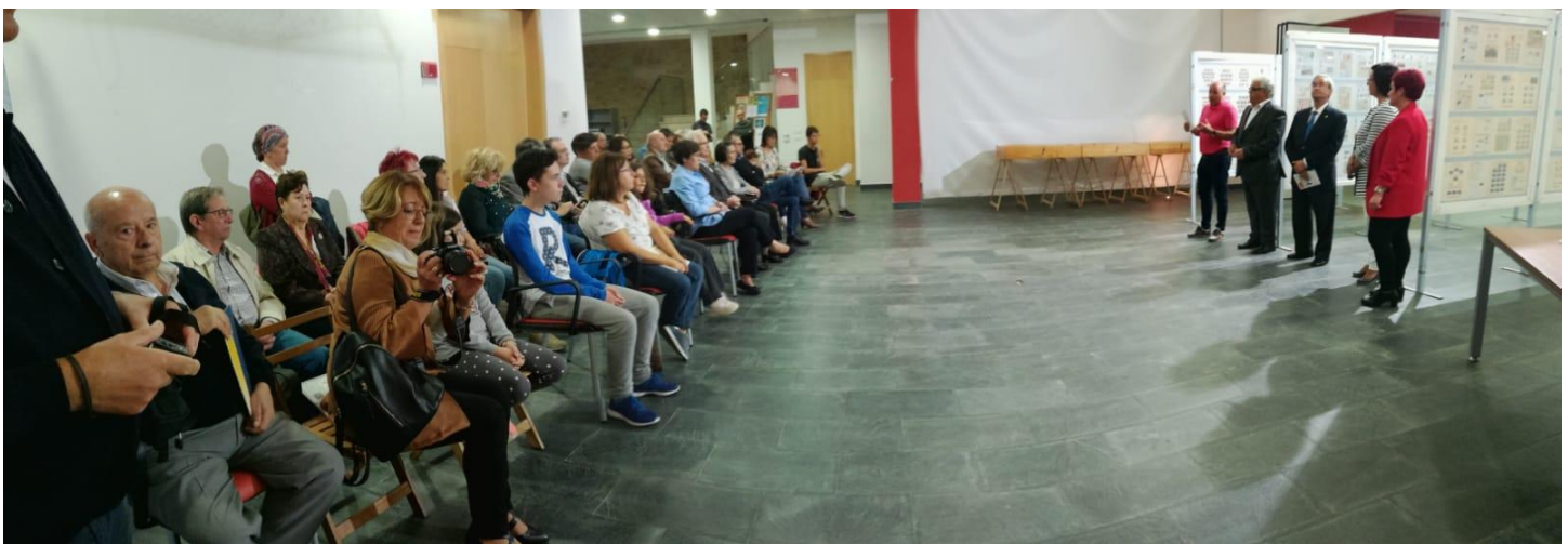
Inauguración da exposición EXFIMIÑO 2018