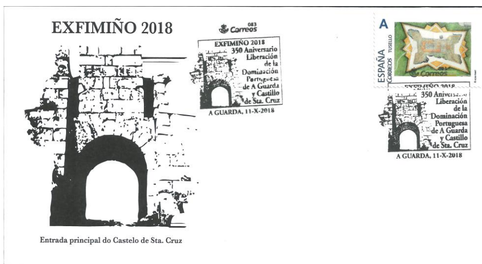
Sobre conmemorativo, con selo personalizado e o matásellos da exposición

A exposición contou cunha ampla participación das mellores coleccións de Galicia e algunha do país veciño Portugal.