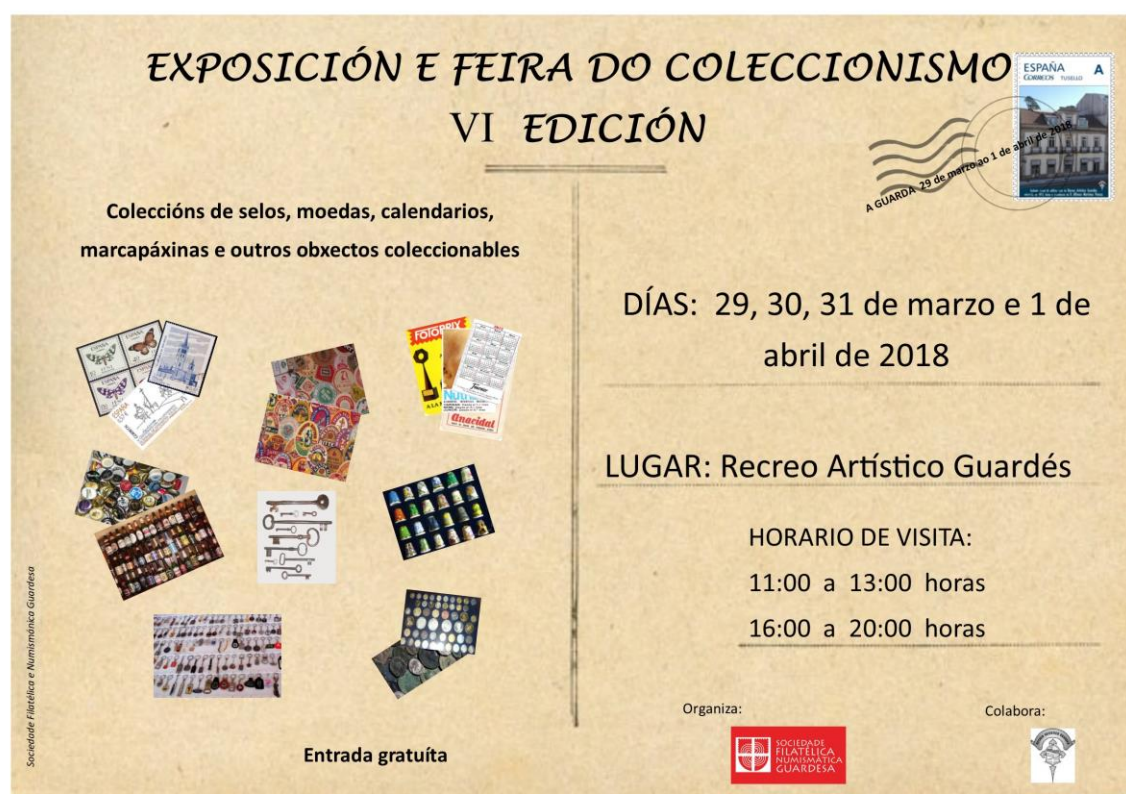
Cartel da VI Exposición e Feira do Coleccionismo

Como ven sendo habitual celebrouse nos salóns do Recreo Artístico Guardés. O horario de visitas foi pola mañá de 11 a 13 horas e pola tarde de 16 a 20 horas. A entrada foi gratuíta para o público.