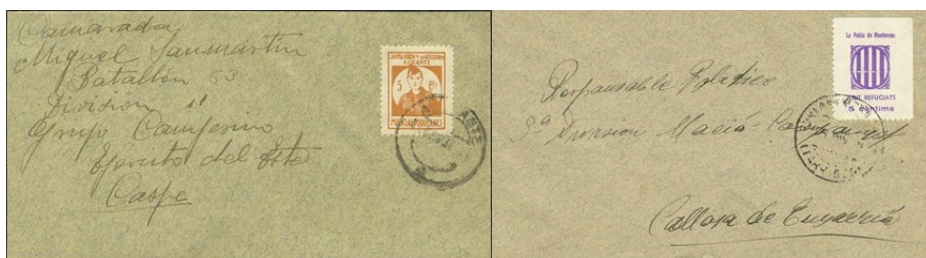
Sobres circulados con sellos benéficos o locales, en este caso con valor de franqueo.

Siempre sería material válido cuando formen parte del documento y tendrían su valor postal al ser empleadas para completar las tarifas postales vigentes y ser admitidas por Correos.