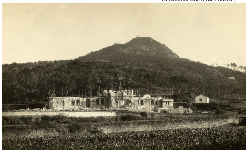
Estado de las obras del Hospital Casa-Asilo en el verano de 1924

Rematado el edificio la Junta Constructora se disolvió, y en 1932 la sustituyó el Patronato del Hospital Casa-Asilo de La Guardia , la institución que se convertiría en la propietaria del nuevo edificio. Y como todo el dinero de los donativos se había gastado en la construcción de dicho inmueble, el patronato lo cedió al Instituto Provincial de Higiene de Pontevedra para la instalación de un «Centro Secundario de Higiene Rural», sostenido en gran medida por los ayuntamientos de la comarca. Este «Centro Sanitario» funcionó cuatro años como hospital, pero nunca como asilo de ancianos, el otro gran sueño de los fundadores del Hospital Casa-Asilo.