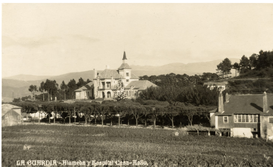
El Hospital Casa-Asilo hacia 1928.

La cesión del edificio al Estado en 1932 para la instalación de un Centro Sanitario tampoco fue la solución ya que su financiación dependía en gran medida de los Ayuntamientos de la comarca, cuyos presupuestos municipales eran siempre muy precarios. Esta fragilidad financiera se puso de manifiesto en diciembre de 1936 cuando, a causa de la Guerra Civil, dichos ayuntamientos redujeron a la mitad sus subvenciones. Y ya en 1941 se negaron a asumir incluso unas obras realizadas en el inmueble. A ello habría que añadir la situación jurídicamente irregular que se daba desde el año 1932 pues el Estado estaba ofreciendo un servicio público en un edificio de naturaleza privada. En estas circunstancias, el Centro Sanitario tenía sus días contados, y de hecho dejó de existir en 1950.