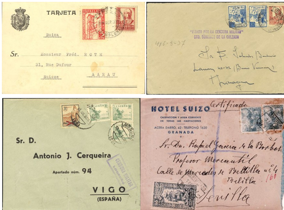
Sobres circulados con sellos benéficos y sin valor de franqueo.

Y los otros emitidos para añadirse con carácter obligatorio, a la tarifa normal de envíos postales para atender a circunstancias o actividades ajenas a Correos. Por lo que su propósito no es transmitir correo y por lo tanto carecen de valor postal.