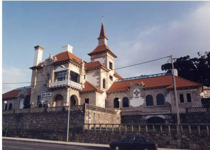
El Centro Cultural recién terminado a finales de 1992.