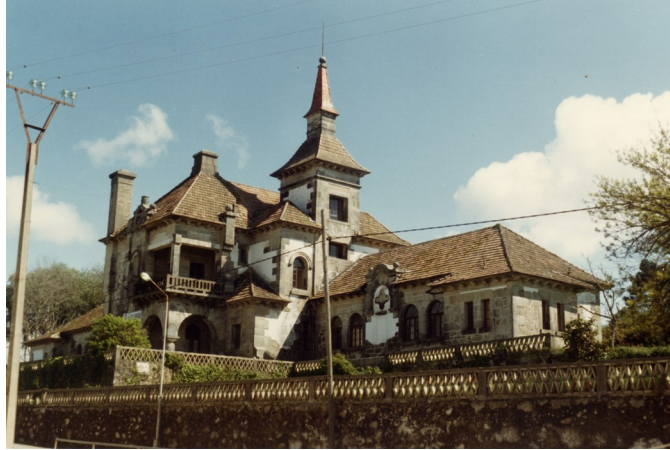
El Hospital Casa-Asilo a finales de los años 80.

Pues bien, para resolver ambas debilidades, la económica y la institucional, se presenta en la actualidad una oportunidad inmejorable pues con la disolución formal de Pro-Monte, en aplicación de artículo 34º de su Reglamento, todos sus bienes y