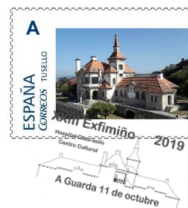
Sobre oficial da exposición