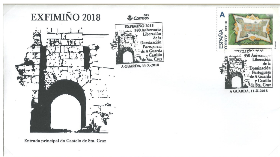
Sobre oficial da Exposición Filatélica EXFIMIÑO 2019, con o correspondente selo e matáselos., diseño de José Ángel Gándara

Puxemos en circulación un selo personalizado con un motivo alusivo a entrada do Castelo de Santa Cruz, así como dun matáselos conmemorativo.