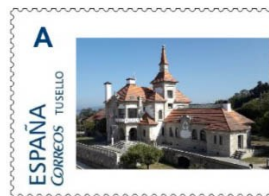
Selo personalizado.