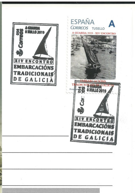
Matasellos da exposición Filatélica (A FILATELIA DO MAR).