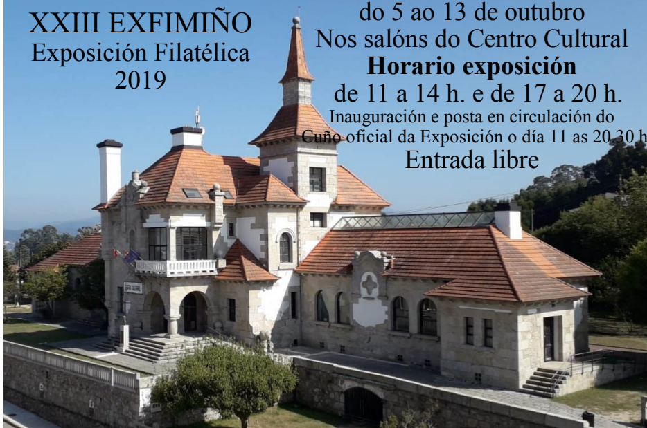
Hospital Casa-asilo actual Centro Cultural de A Guarda

do 5 ao 13 de outubro Nos salóns do Centro Cultural Horario exposición de 11 a 14 h. e de 17 a 20 h. Inauguración e posta en circulación do Cuño oficial da Exposición o día 11 as 20.30 h Entrada libre