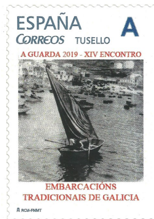
Selos personalizados utilizados na exposición filatélica A FILATELIA DO MAR.