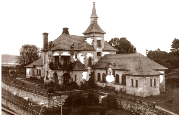
El Hospital Casa-Asilo en 1957.

Otra causa del fracaso del Patronato del Hospital Casa-Asilo fue su debilidad institucional , pues se diseñó siguiendo un modelo basado en la beneficencia tradicional, de cuando el Estado no existía o no cubría estas necesidades. Así, su esquema económico era antiguo –unos benefactores aportaban dinero para que con sus intereses se sufragasen camas y