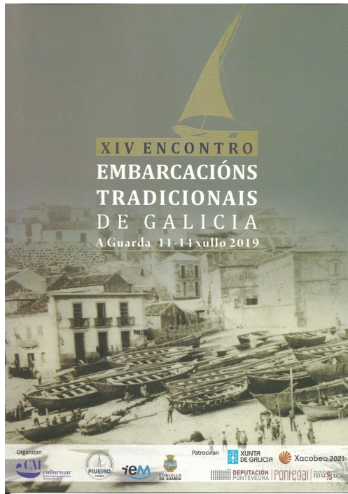
Tarxeta oficial da Mostra