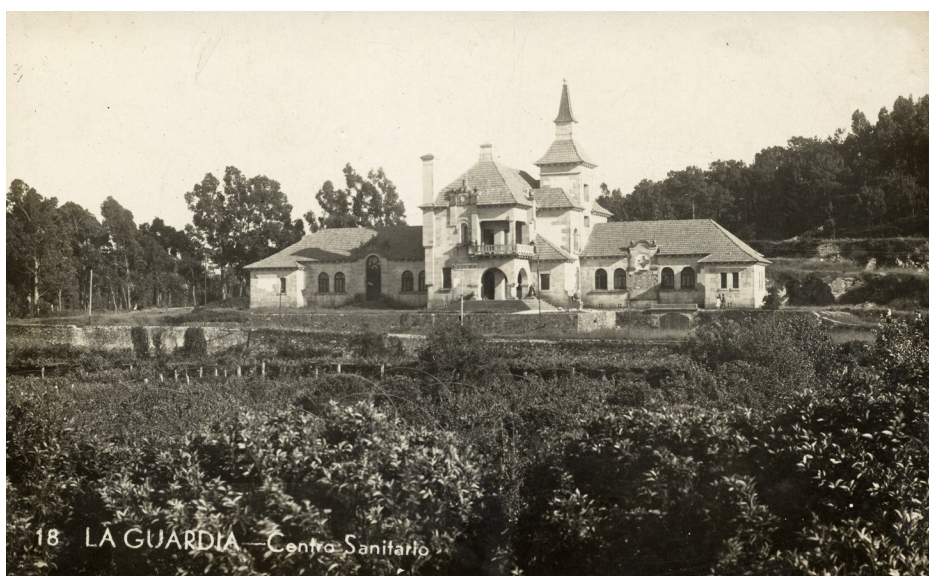
El Hospital Casa-Asilo hacia 1933, ya con el cartel «Centro Sanitario» en la entrada.

Sin embargo, en 1964 la Dirección General de Beneficencia se lo negó porque tales entidades necesitaban poseer capital suficiente para su funcionamiento, del que en este caso se carecía totalmente. Así pues, el Patronato era dueño de un flamante edificio que, sin embargo, no podía destinar al fin para el que fuera creado. Sólo se mantuvo un dispensario antituberculoso hasta 1967, y en la década de 1980 un consultorio médico. La realidad es que A Guarda no tendría un Centro de Salud hasta el año 1993, y un asilo de ancianos nada menos que hasta 2005.