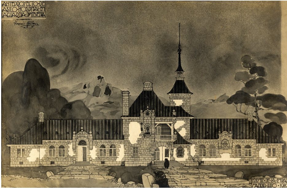
Anteproyecto del Hospital Casa-Asilo de julio de 1919.

El Hospital Casa-Asilo de A Guarda, hoy Centro Cultural, construido en la década de 1920, es tal vez el edificio más representativo de la localidad. Su sola imagen, e incluso su silueta, está ya asociada a la villa guardesa, y por lo tanto la identifica. Se ha convertido pues en un icono , lo mismo que la Torre del Reloj o la «casa celta» levantada en 1965 por la Sociedad Pro-Monte. En este artículo queremos volver a recordar la historia de esa construcción egregia; pero también la de sus artífices, los emigrantes guardeses a Puerto Rico, lo que la convierte en una obra colectiva, y al mismo tiempo en una espectacular «casa india». Todo un paradigma del fantástico legado que representa el singular conjunto de casas indianas que posee el municipio de A Guarda.