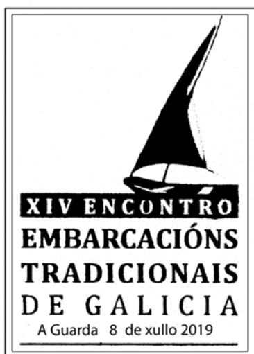
Cuño da mostra

O pasado luns 8 de Xulio as 21:00 horas inauguramos a exposición filatélica A Filatelia do Mar . Esta exposición estaba dentro das diversas actividades que se realizaron durante o XIV Encontro de Embarcacións Tradicionais de Galicia en A Guarda.