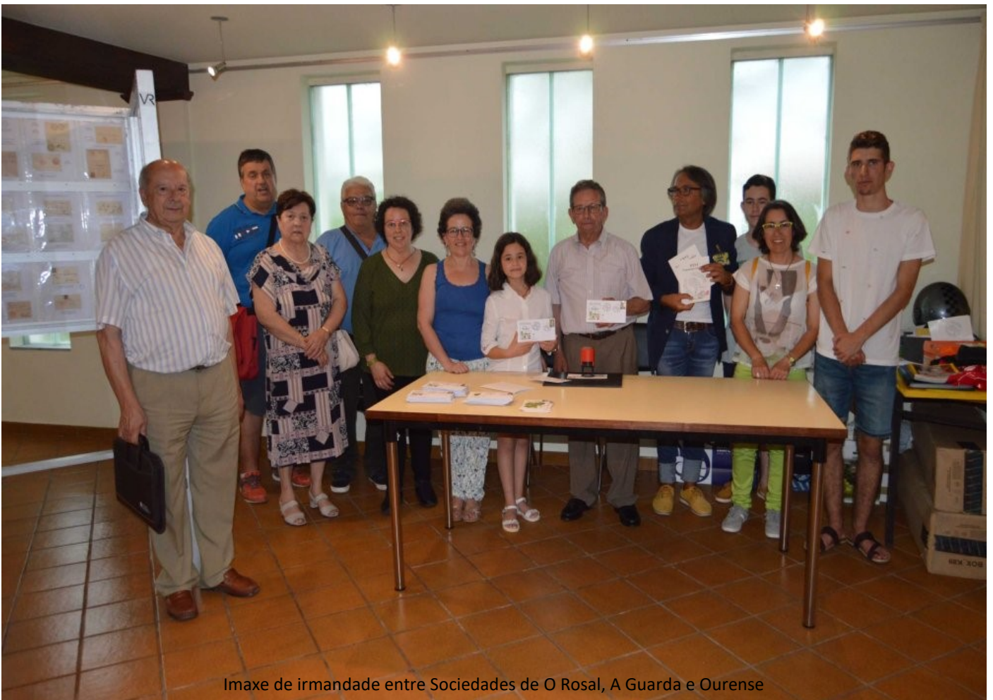
Imaxe de irmandade entre Sociedades de O Rosal, A Guarda e Ourense