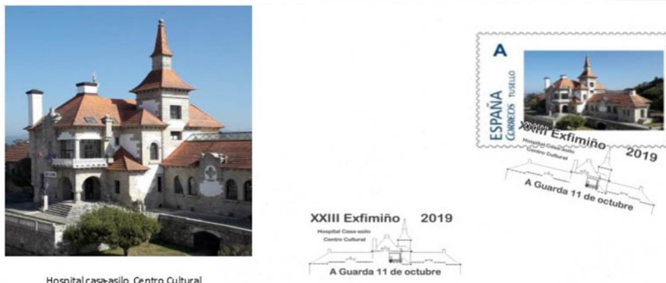
Sobre, sello e cuño oficial da exposición

Os días 5 ao 13 de outubro, a Sociedade Filatélica e Numismática Guardesa celebrou en A Guarda a Exposición EXFIMIÑO 2019, Este Ano celebramos a XXIII edición da exposición EXFIMIÑO y estivo dedicado ao edificio do Hospital Casa-asilo na actualidade Centro Cultural.