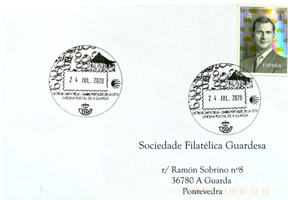
Carta co Cuño Turístico definitivo circulada o primeiro día de presentación.

Este cuño é un pequeno agradecemento de parte da Sociedade Filatélica e Numismática Guardesa a todas esas persoas que loitaron, investigaron e quixeron que o poboado máis grande do noroeste peninsular, o Castro de Santa Trega, o coñecera todo o mundo.