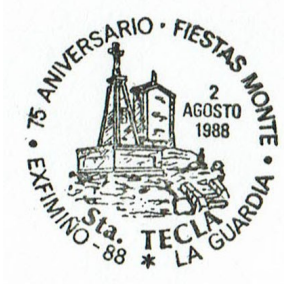
5ª Exfimiño 1988