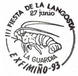
6ª Exfimiño 1993