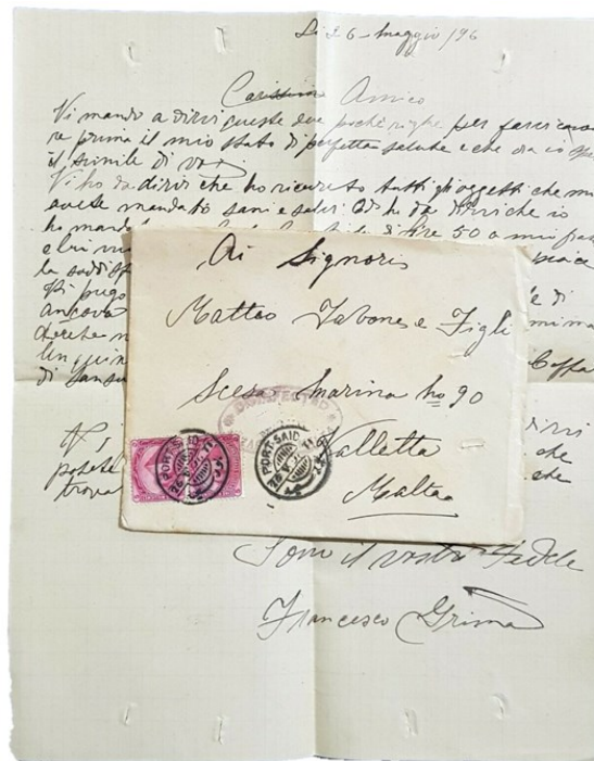
1896, Carta de Egipto a Malta correo Lazareto

El correo era imprescindible y necesidad de comunicarse a través de ello y su conservación, no podían utilizarse métodos destructivos de desinfección, comenzando a usarse primitivamente la simple aireación, agua de mar o vinagre.