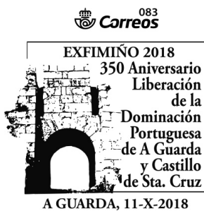
22ª Exfimiño 2018