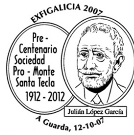
3ª Exfigalicia 2007