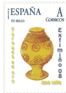
Torques de Ouro. Data de emisión 18/10/2008