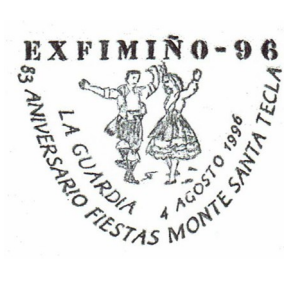
8ª Exfimiño 1996