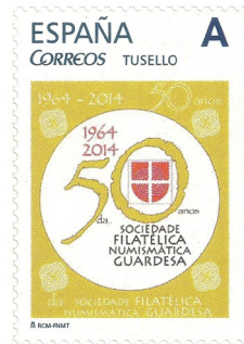
50 Aniversario da S.F. e N.G. Data de emisión 4/10/2014.