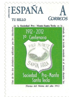
1º Centenario. Sociedad Pro Monte Sta. Tecla Data de emisión 1/11/2012