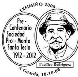
13ª Exfimiño 2008