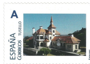
Hospital Casa Asilo Actual Centro Cultural. Data de emisión 11/10/2019