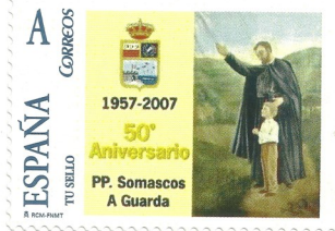
50º Aniversario da chegada dos PP Somascos a A Guarda. Data de emisión. 1/11/2007 Este selo e propiedade do colexio dos Padres Somascos