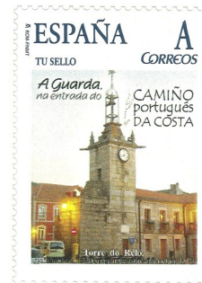
Camiño Portugués da Costa. Data de emisión 8/10/2010