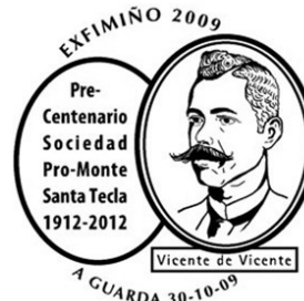
14ª Exfimiño 2009