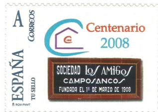
Centenario da Sociedade Los Amigos de Camposancos Data de emisión 1/03/2008 Propiedade da sociedade Los Amigos