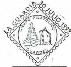
10ª Exfimiño 1999