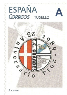
25 Aniversario CC Ciclista Guardés. Data de emisión 4/10/2014. Propiedade do C.C Guardés