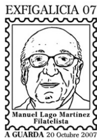
3ª Exfigalicia 2007