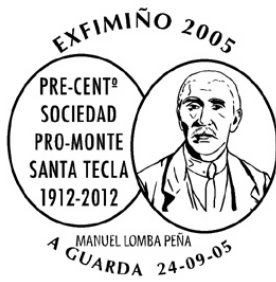
12ª Exfimiño 2005