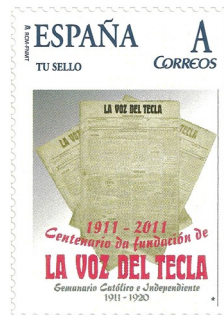
Centenario de la Voz del Tecla. Data de emisión 12/10/2011