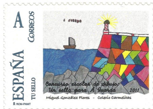
Un selo para A Guarda Data de emisión. 12/10/2011