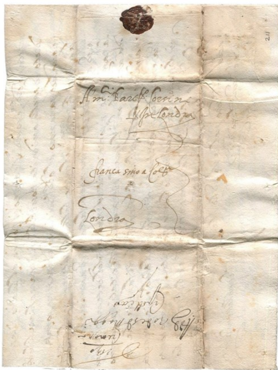
1590, Correo desinfectado de Cremona (Italia) a Londres

A pesar que estamos viviendo tiempos de pandemias, algo novedoso para nosotros, no tanto para la historia de la humanidad que ha vivido epidemias, pestes, plagas etc., pruebas evidentes de ello tenemos en el correo un elemento transmisor de enfermedades, una prueba de ello lo podemos comprobar en la Historia Postal.