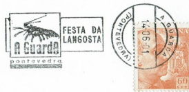
Matasellos de Rodillo 2001