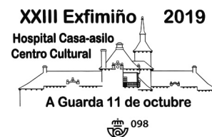
23ª Exfimiño 2019