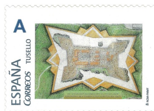
350 anos do fin do dominio Portugués en A Guarda. Data de emisión 11/10/2018