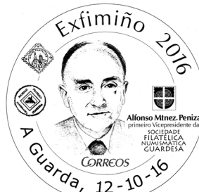
20ª Exfimiño 2016