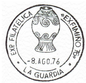
3ª Exfimiño 1976