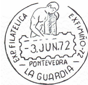
2ª Exfimiño 1972