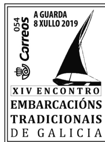
XIV Encontro Embarcacións tradicionais de Galicia 2019