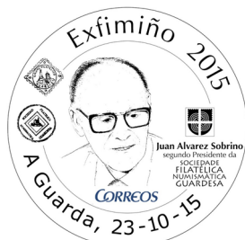
19ª Exfimiño 2015