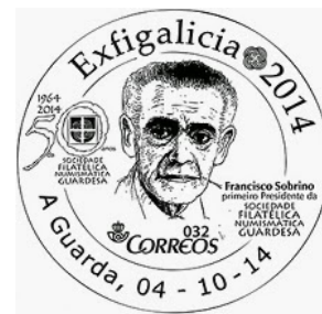
4ª Exfigalicia 2014