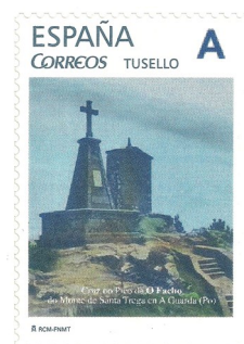
50 Aniversario das siglas EXFIMIÑO Data de emisión 4/10/2017