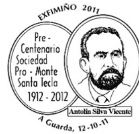
16ª Exfimiño 2011