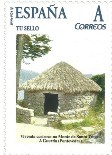
Vivenda castrexa no Monte Sta. Trega Data de emisión. 12/10/2007