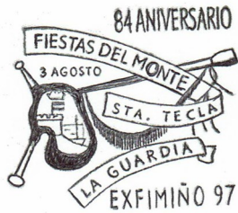
9ª Exfimiño 1997