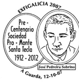
3ª Exfigalicia 2007