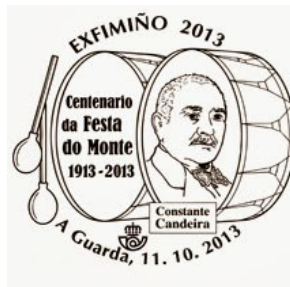
18ª Exfimiño 2013