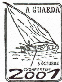
1ª Exgaportem 2001