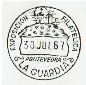
1ª Exfimiño 1967