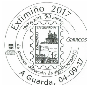
21ª Exfimiño 2017