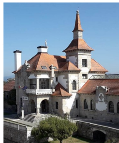
Hospital casa-asilo Centro Cultural XXIII EXFIMIÑO 2019

Así mesmo asistiron o acto de inauguración representantes dos distintos grupos políticos e de asociacións culturais, público en xeral e membros da xunta directiva da SFeNG.