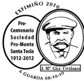
15 Exfimiño 2010