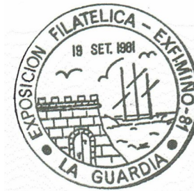
4ª Exfimiño 1981