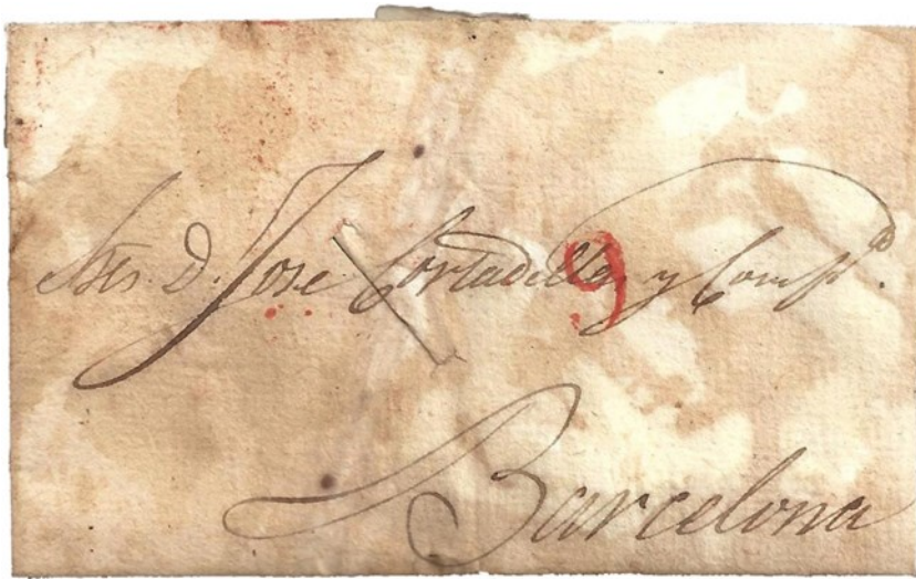
1834, de Madrid a Barcelona con cortes de desinfección y Vinagre

En resumen a lo largo de estos años se ha recurrido a todo tipo de procesos y elementos, sulfatos, mirra, incienso, agua de mar, formol o vinagre entre otros muchos, para evitar el contagio mediante el correo.