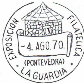
1ª Exfiglicia 1970