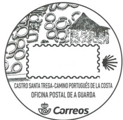
Bosquexo enviado a Correos.

Este cuño é un pequeno agradecemento de parte da Sociedade Filatélica e Numismática Guardesa a todas esas persoas que loitaron, investigaron e quixeron que o poboado máis grande do noroeste peninsular, o Castro de Santa Trega, o coñecera todo o mundo.