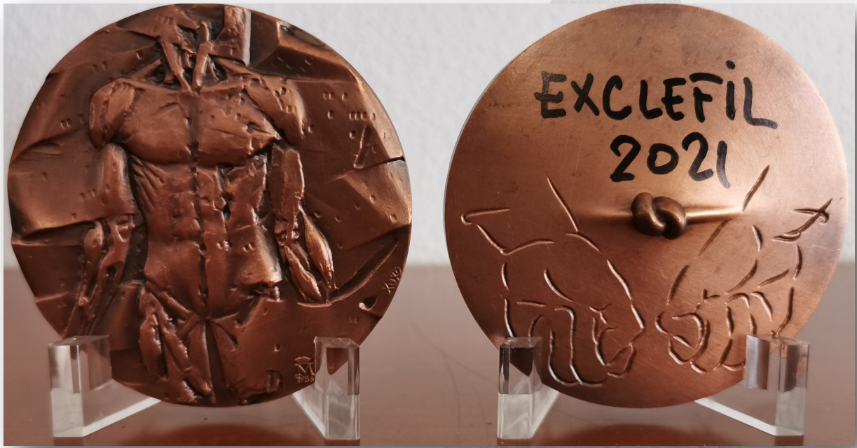
ESCLAVO SIGLO XX - (FABRICA NACIONAL DE MONEDA Y TIMBRE - RCM)