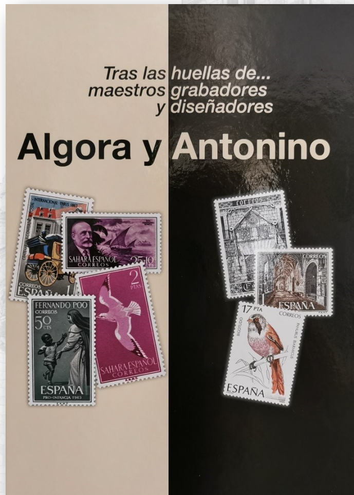
MAESTROS GRABADORES - (FABRICA NACIONAL DE MONEDA Y TIMBRE - RCM)