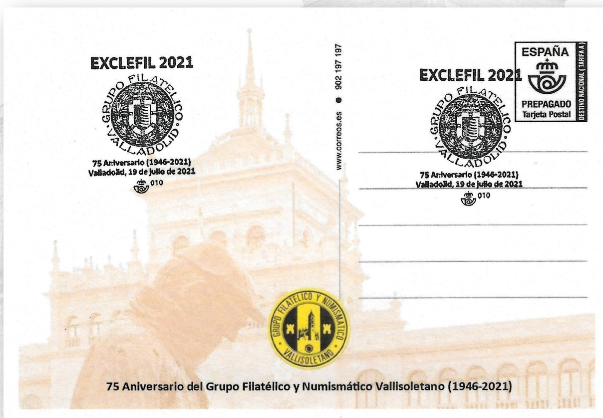
ANVERSO (Miguel Delibes y Academia de Caballería)