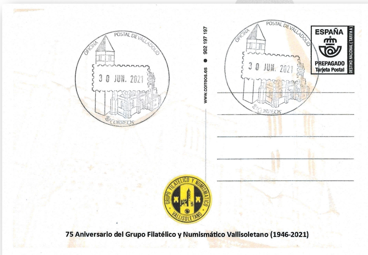
ANVERSO (Iglesia de Santa María de la Antigua)